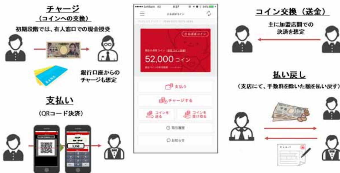
(図表3) 地域通貨プラットフォームの概要

同社は、2016年11月から、飛騨信用組合と電子地域通貨プラットフォームの構築に取り組んでいる(図表3)。