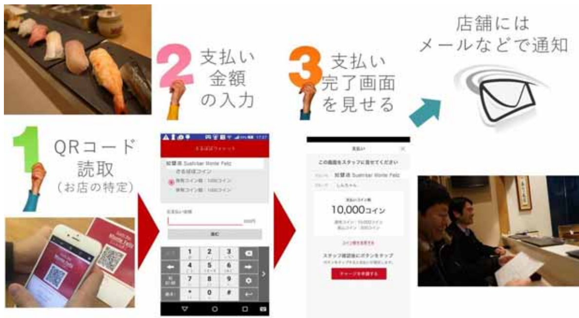
(図表4) 地域通貨「さるぼぼコイン」の支払いフロー