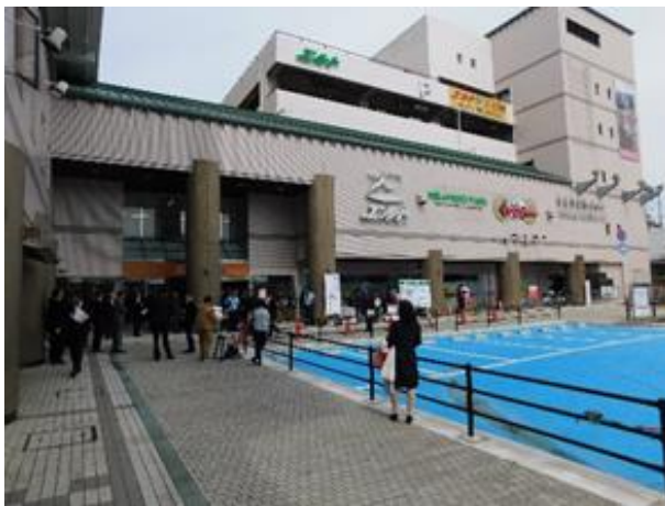
（図表5）駅前商業ビル（エルト桜井）