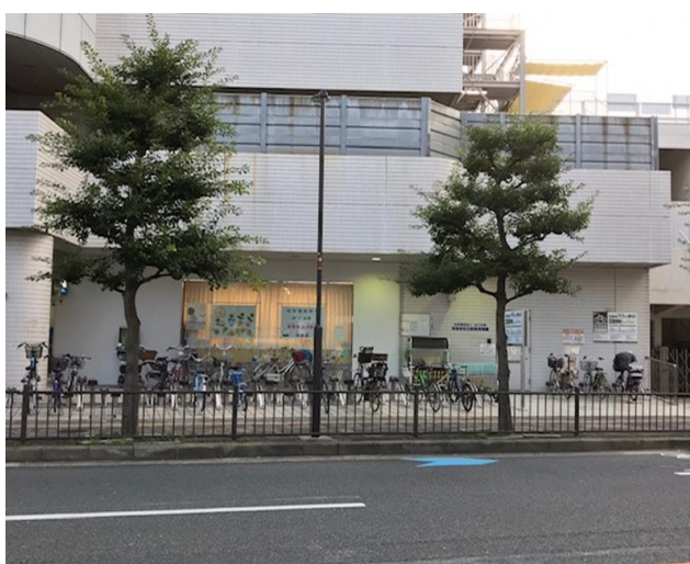
(図表5) 保育園の外観

同金庫は地域貢献活動としてめぐみ会に対し実質無償で貸与しており、めぐみ会は同保育園の運営にあたって、ビルの管理費および固定資産税を負担している。