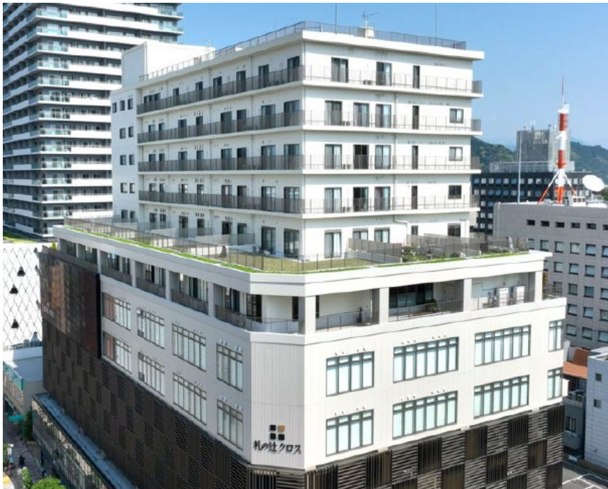
(図表4) 投資対象物件