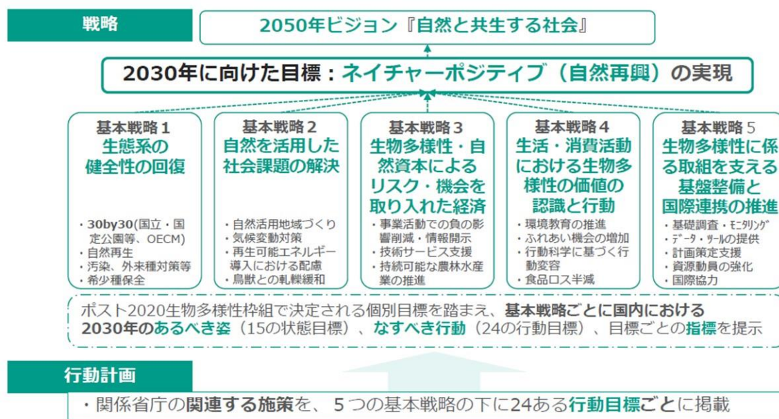
(図表4) 次期生物多様性国家戦略の概要