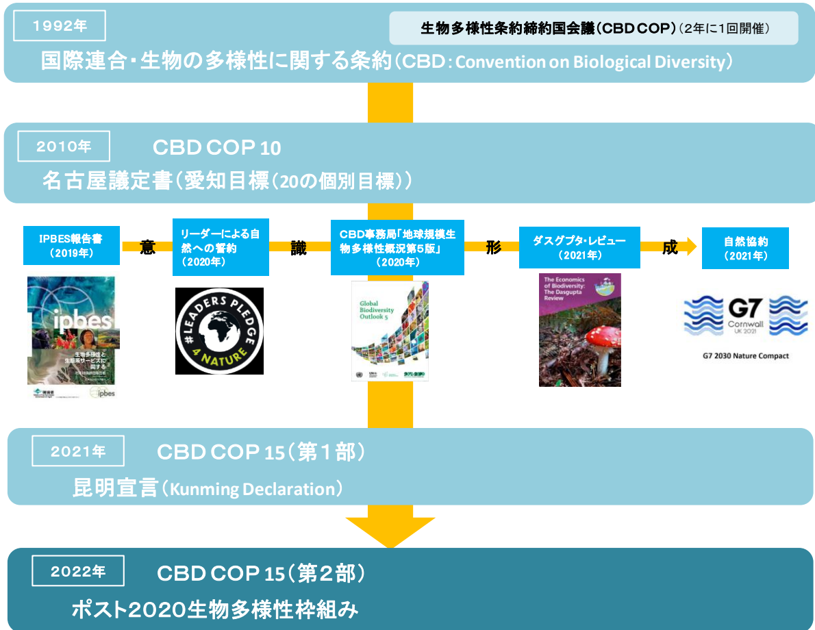
(図表 1) 生物多様性の潮流

(備考) 各種ホームページおよび報道資料等を基に信金中央金庫 地域・中小企業研究所作成