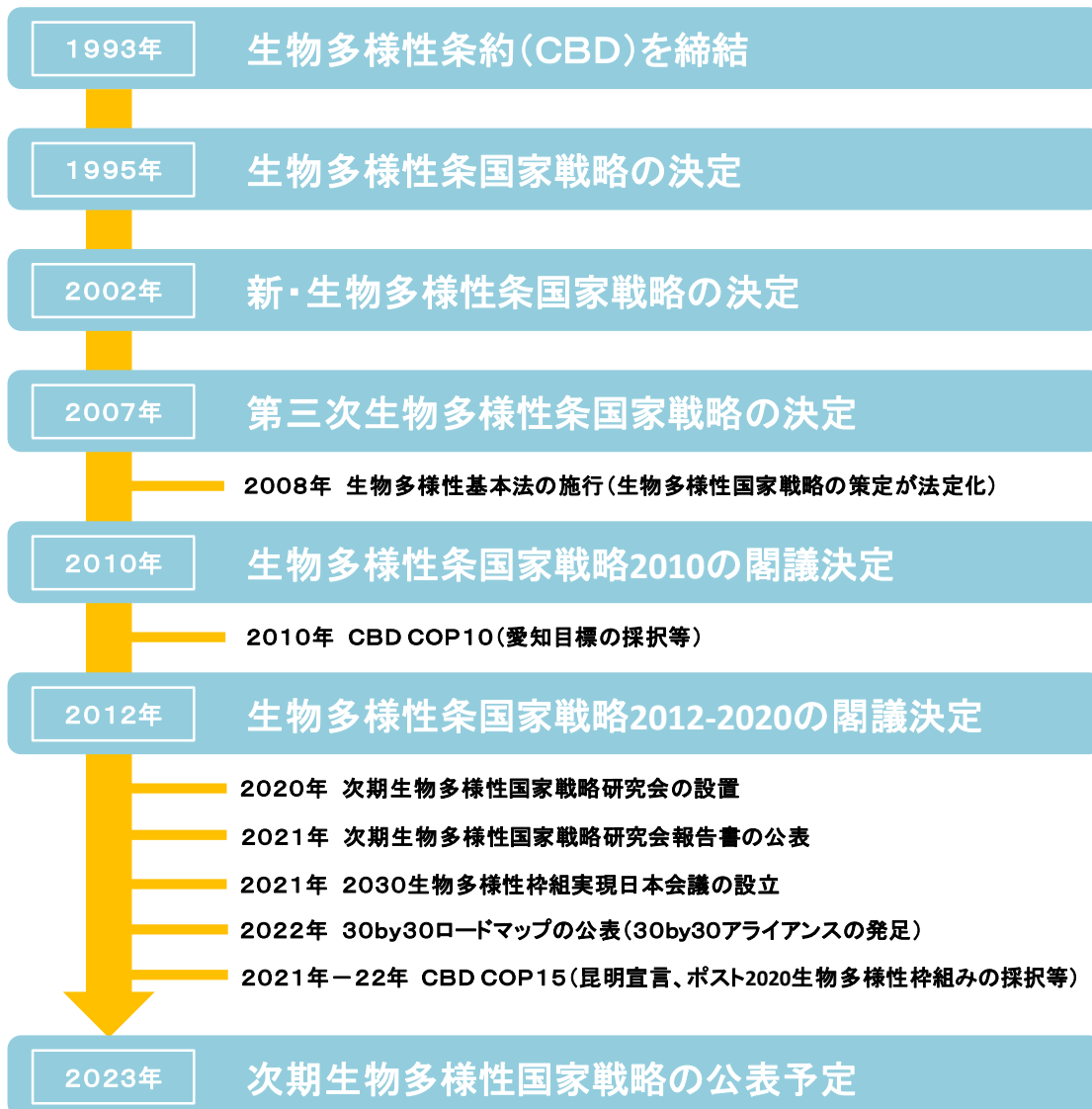
(図表3) 生物多様性国家戦略の策定経緯