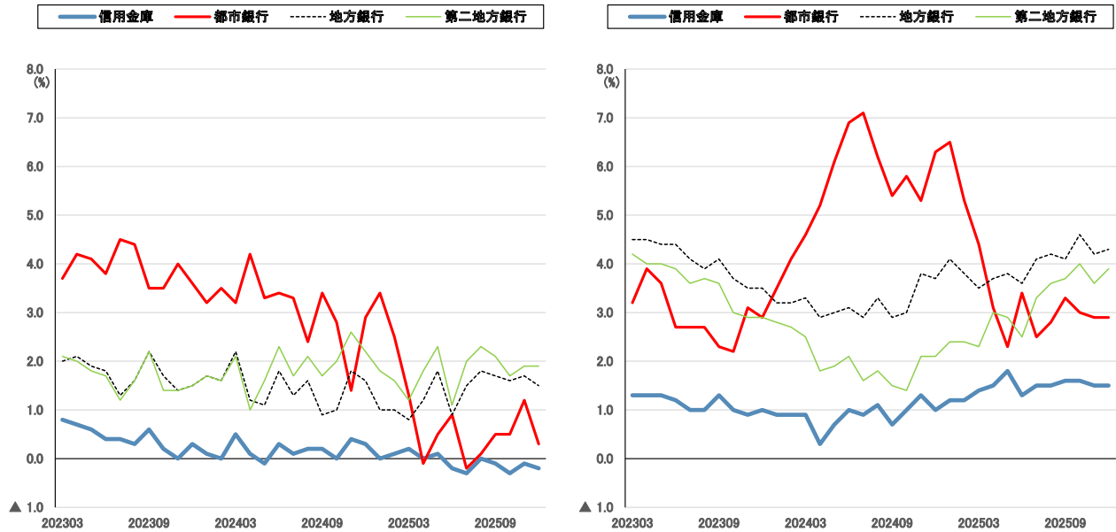
(図表3) 業態別の動向(左図:預金、右図:貸出金)

(備考) 1. 信金中央金庫 地域・中小企業研究所作成 2. 他業態は全国銀行協会「全国銀行預金・貸出金等速報」より作成(業態間の合併は未調整)