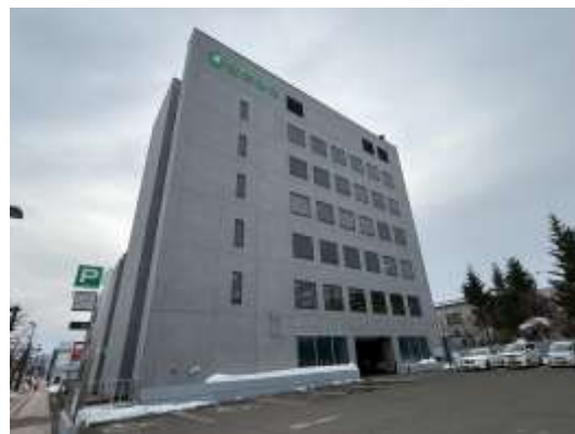
（図表2）本店・本部の外観